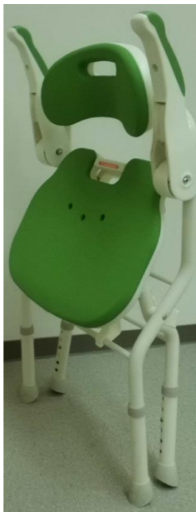
【折りたたんだ状態】